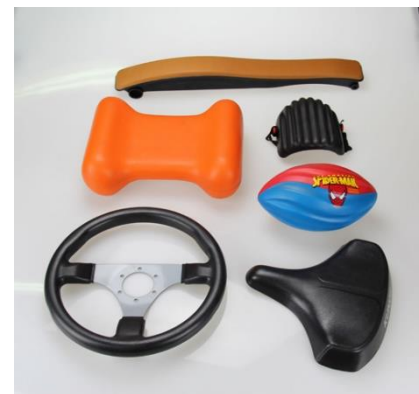
Продукция с пенополиуретановым покрытием

За исключением производства монтажной пены, во всех вышеуказанных сферах применения пеноматериалов используются готовые материалы, изготовленные на специализированных фабриках. Монтажная пена производится по месту (т.е. с применением переносного оборудования по месту проведения изоляционных работ). Это важный аспект, поскольку он требует соблюдения мер безопасности, связанных с воспламеняющимися вспенивателями.