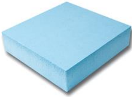
Панель из экструдированного пенополистирола