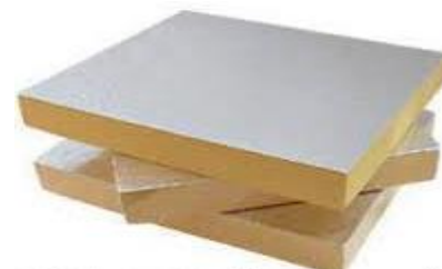
PF Pre-insulated Board Composite Aluminum Foil