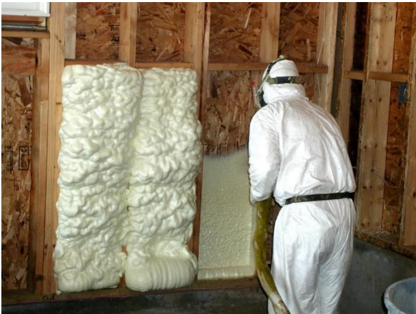
Использование монтажной пены