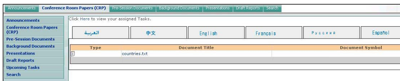
图3 - 会议室文件、会前文件和报告草案将以联合国六种官方语文提供