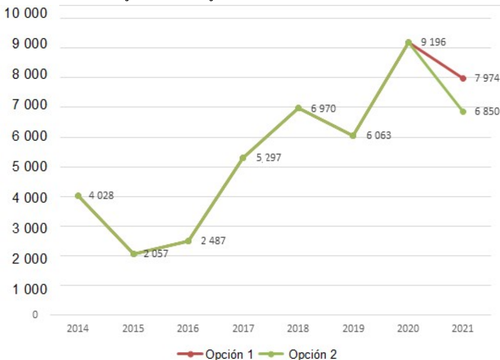
Figura 1 Evolución del saldo de caja al cierre del ejercicio